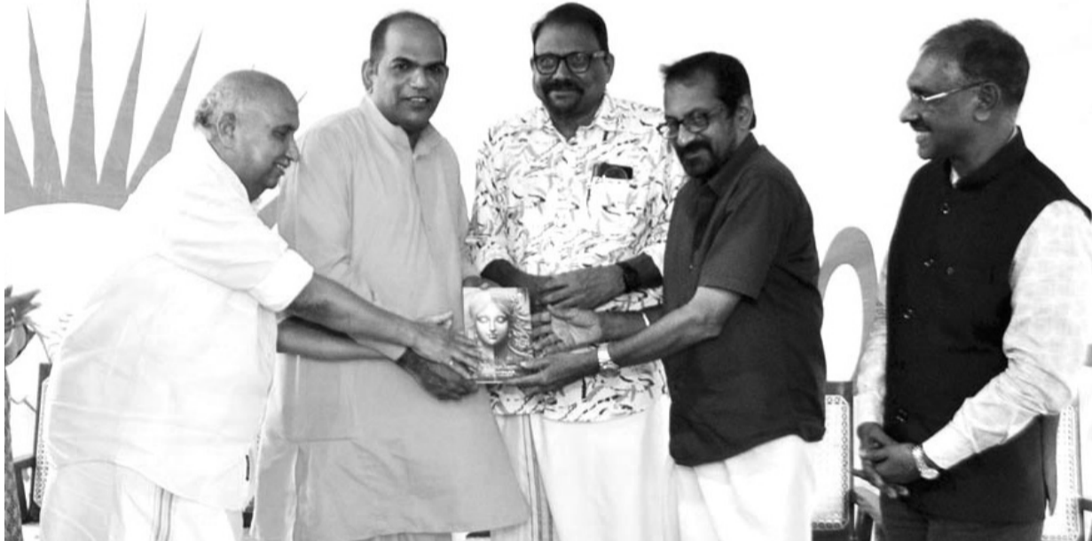
'അതിന്ദ്രിയ മനസ്സ്'- ആത്മീയതയുടെ പ്രകാശം എന്ന കൃതി സാമീപ്യം പുസ്തകങ്ങളുടെയും പ്രകാശനം ചെയ്യുന്നു

* കുറഞ്ഞ യോഗ്യത : പത്താംക്ലാസ് പാസ്സ് * പ്രായപരിധിയില്ല വിദ്യാർത്ഥികൾക്കും ജോലി ചെയ്യുന്നവർക്കും തൊഴിൽപരമായ നൈപുണ്യവർദ്ധനവ് ആഗ്രഹിക്കുന്ന ഏവർക്കും ഡിജിറ്റൽ മേഖലയിലെ കരിയർ സാധ്യതകൾ ഈ കോഴ്സുകൾ തുറന്നു നൽകുന്നതാണ്. കൂടുതൽ വിവരങ്ങൾക്കും പ്രവേശനത്തിനുമായി ബന്ധപ്പെടുക. PH +91 8921924066 / 9447654642 വെബ്സൈറ്റ് : www.bharatsevaksamaj.org