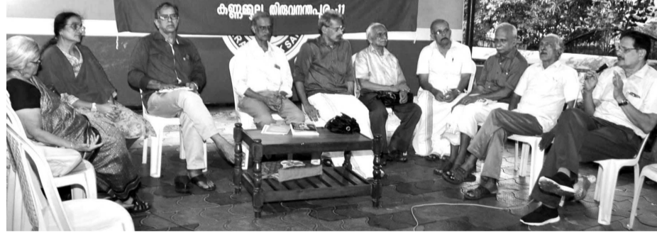
ബി.എസ്.എസ് സംസ്കാരഭാരതത്തിന്റെ ആഭിമുഖ്യത്തിലും വിദ്യാധിരാജ അക്ഷരശ്ലോക സമിതിയുടെ നേതൃത്വത്തിലും സദ്ഭാവനാ ഭവൻ ആഡിറ്റോറിയത്തിൽ നടന്ന അക്ഷരശ്ലോക സദസ്സ്

ബി.എസ്.എസ് 'സംസ്കാരഭാരതം'ത്തിന്റെ ആഭിമുഖ്യത്തിൽ സംഘടിപ്പിക്കപ്പെട്ട അക്ഷരശ്ലോകസദസ്സ് ശ്രദ്ധേയമായി. വിദ്യാധിരാജ അക്ഷരശ്ലോക സമിതിയുടെ നേതൃത്വത്തിലാണ് സദസ്സ് നടന്നത്. ഒരാൾ ശ്ലോകം ചൊല്ലിയാൽ ആ ശ്ലോകത്തിന്റെ മൂന്നാം പാദത്തിന്റെ ആദ്യത്തെ അക്ഷരത്തിൽ തുടങ്ങുന്ന ശ്ലോകം അടുത്തയാൾ ചൊല്ലണമെന്ന വ്യവസ്ഥയോടുകൂടി അരങ്ങേറപ്പെടുന്ന അക്ഷരശ്ലോക മത്സരങ്ങളും പരിപാടികളും ഇന്ന് വിരളമായേ കാണാറുള്ളൂ. അതുകൊണ്ടുതന്നെ സദ്ഭാവനാ ഭവൻ ആഡിറ്റോറിയത്തിൽ നടന്ന അക്ഷരശ്ലോക സദസ്സ് ഏറെ ശ്രദ്ധേയമായി. അക്ഷരശ്ലോകരംഗത്തെ പരിണതപ്രജ്ഞരായ കലാകാരന്മാർ സദസ്സിൽ പങ്കെടുത്തു.