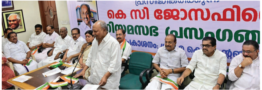
മുൻ മുഖ്യമന്ത്രി എ.കെ. ആന്റണി പുസ്തകം പ്രകാശനം ചെയ്ത് സംസാരിക്കുന്നു