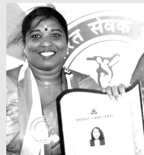
കലാ രാണി. എസ്