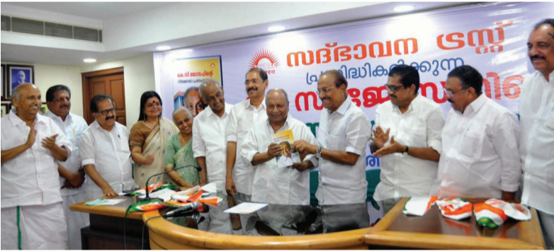
കോൺഗ്രസ് ദേശീയ നേതാവ് എ.കെ. ആന്റണി മുൻപിലിം ലീഗ് നേതാവ് പി.കെ. കുഞ്ഞാലിക്കുട്ടിക്ക് പുസ്തകം നൽകി പ്രകാശനം ചെയ്യുന്നു