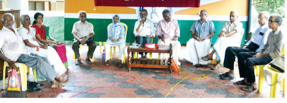
ബി.എസ്.എസ് സംസ്കാര ഭാരതത്തിന്റെയും കണ്ണമ്മുല അക്ഷരശ്ലോക സമിതിയുടെയും സംയുക്താഭിമുഖ്യത്തിൽ സംഘടിപ്പിക്കപ്പെട്ട അക്ഷരശ്ലോക സദ്ഭാവന